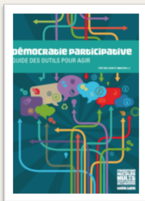
Démocratie participative guide des outils pour agir (2013)