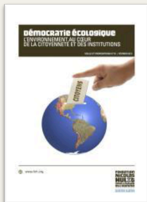
Démocratie écologique (2012)